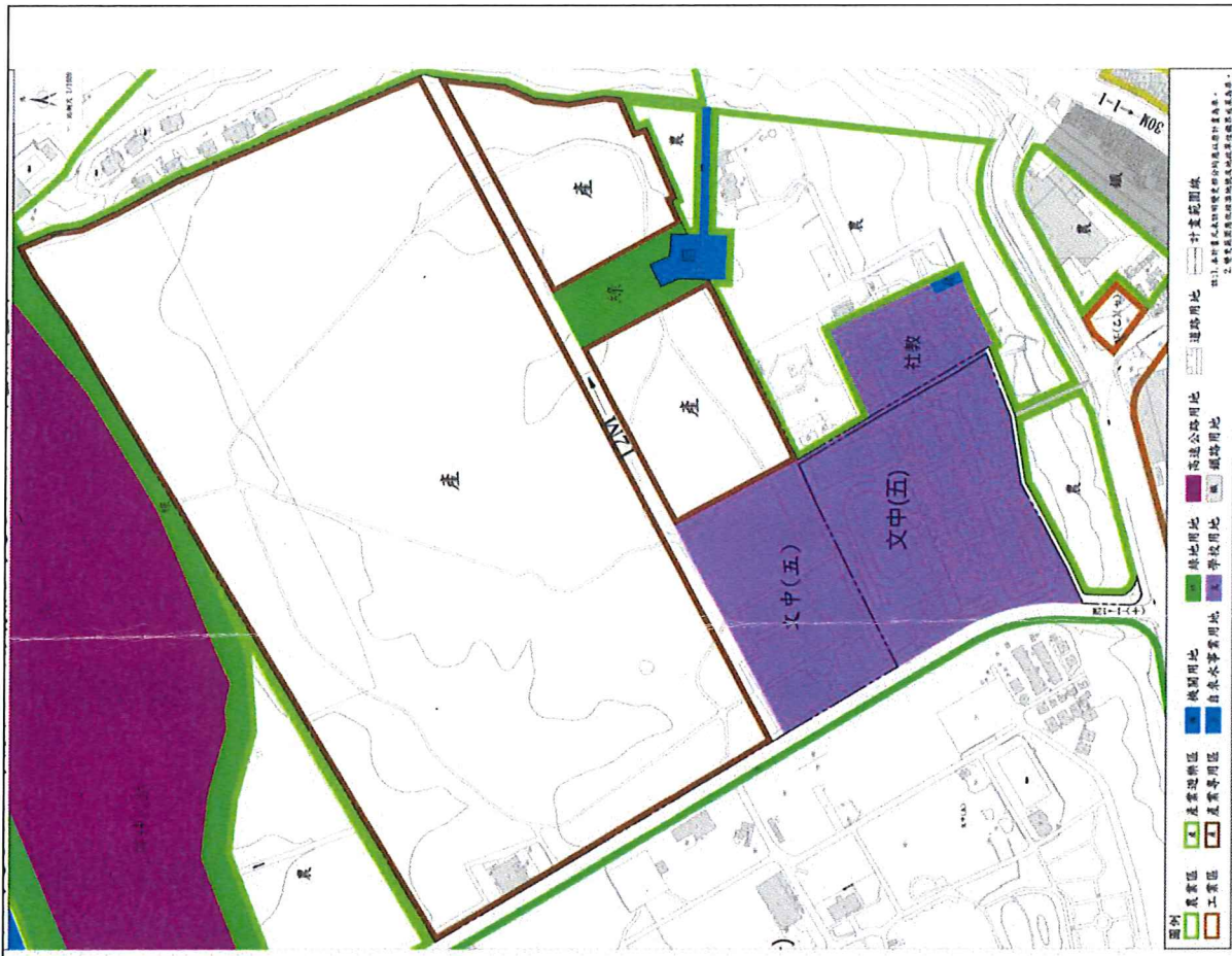
細部計畫變更內容示意圖